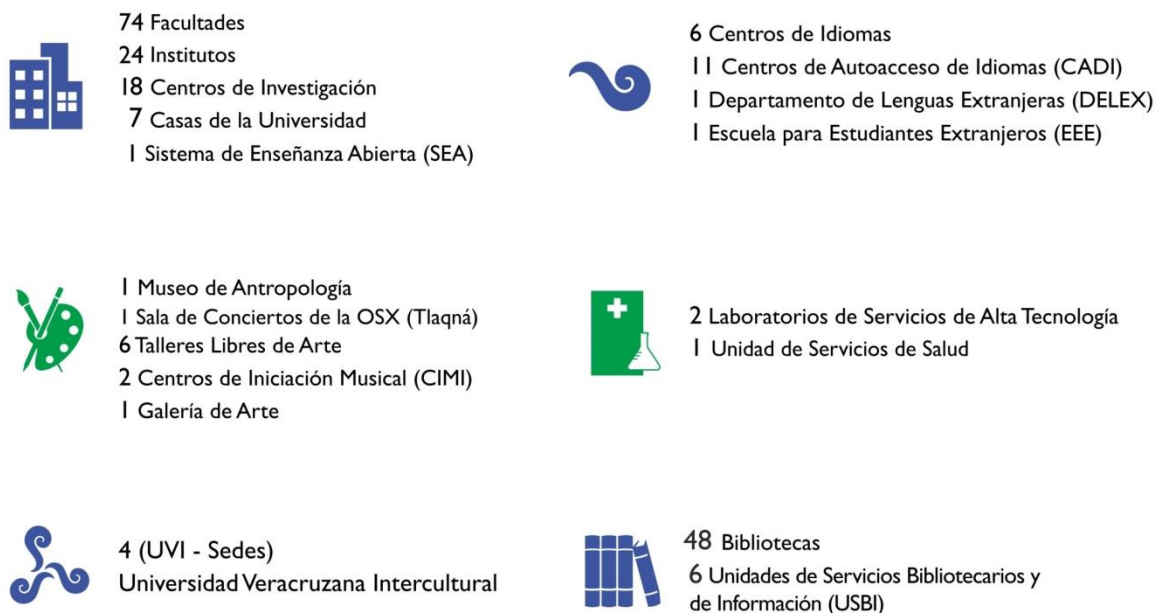
Figura 2 Entidades y dependencias de la Universidad Veracruzana